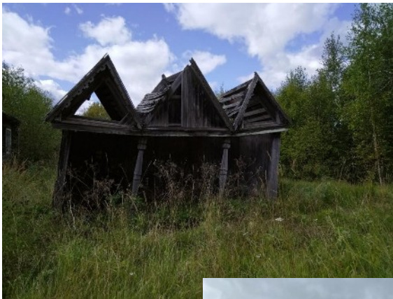
До реализации проекта