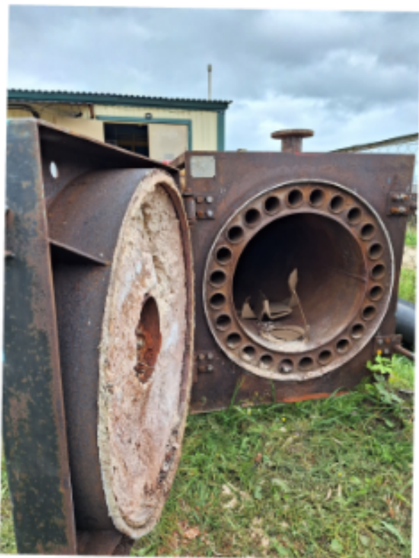
До реализации проекта