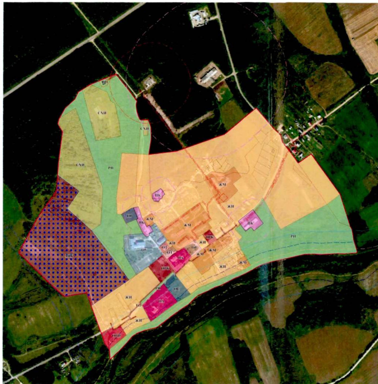
Карта № 1.1